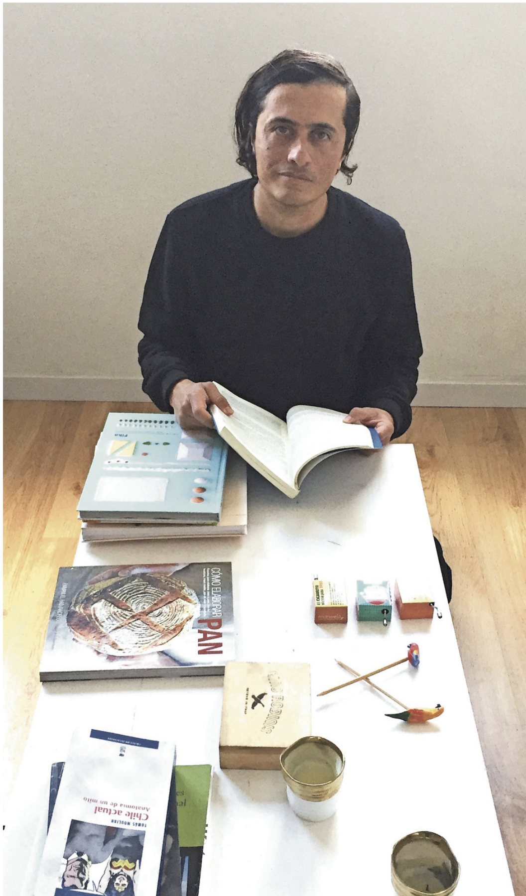
Por Juan Carlos Ramírez F. ( 29 de diciembre 2017)