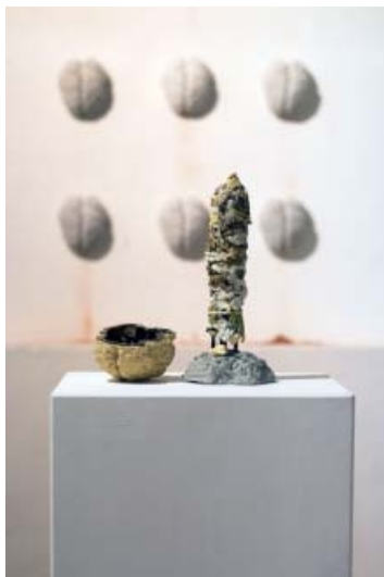
Social Sculpting af Julie Bitsch (Installationsview).

I rummet bidrager også Julie Bitsch, der til daglig har værksted på PB43, med værket Social Sculpting , en performativ installation, hvor publikum inviteres til at modellere en falløs i tyggegummi, der efterfølgende støbes i bronze. Almindelige borgere sætter sit tandaftryk på en fallisk form, som foreviges. Værket kommenterer således på