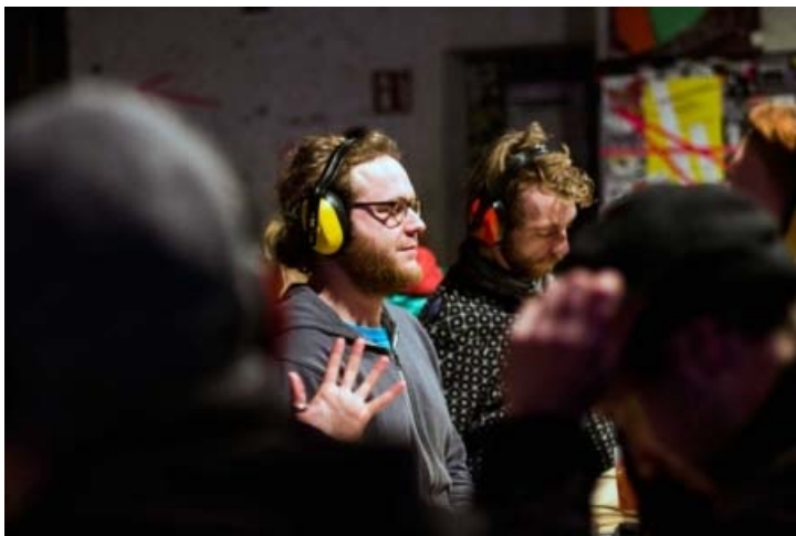
Til finissagen skabte PB43 en af deres Lydløse Frokoster.

Østeuropæisk kunst Machine-RAUM Street Art / Graffiti