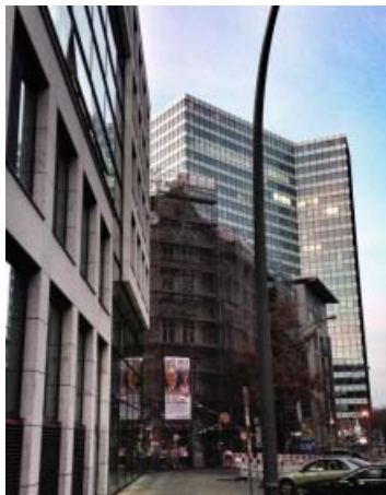
En af Gängeviertels bygninger op mod den omkringliggende by.

Gängeviertel er et brugerdrevet kulturhus og udstillingssted, og bygningernes forsmåede tilstand mod de polerede kontorbygninger er i følge Carsten Rabe et udemærket udtryk for den kulturelle tilstand i Hamborg midtby.