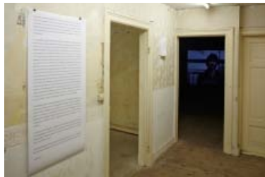
Telling Stories på 68m2 (installationsview)