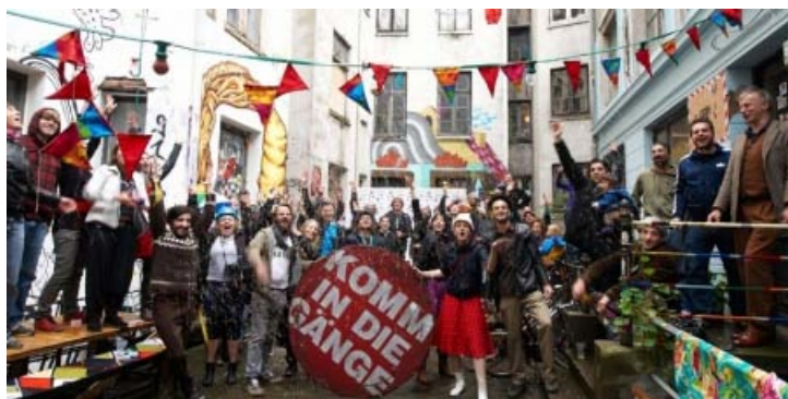
Sloganet "Komm in die Gänge" betyder både 'kom i gang!' og 'besøg Gängeviertel!'.

For anden gang afholdes Copenhagen Art Week 29. august til 7. september. Et omfattende program, der sætter kunsten i fokus med messer, udstillinger, talks, guidede ture og fester. Her kan du blive opdateret og inspireret.