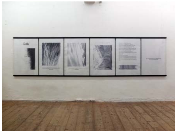
GAU (tysk for katastrofe) af Anne Skole Overgaard for Sydhavnen Station. Foto: Anne Skole Overgaard.

Lille Moskva kaldte man området, og koncentrationen af jøder og kommunister er i følge Rabe nok en del af grunden til, at NSP ikke var langsomme til at rive bygninger ned, da de kom til magten. Den britiske tæppebombning af Hamborg under 2. verdenskrig bidrog også til en brutal 'oprydning i gængerne'.