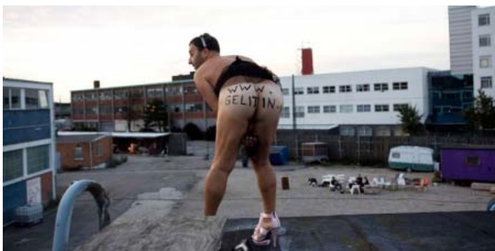
Gelitin: Opening Performance , 2011.

For anden gang afholdes Copenhagen Art Week 29. august til 7. september. Et omfattende program, der sætter kunsten i fokus med messer, udstillinger, talks, guidede ture og fester. Her kan du blive opdateret og inspireret.