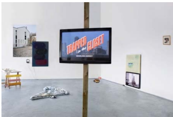
Installationsview, Modelling Agency .