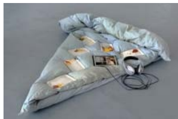
Michele Pagel: El Calzone , 2011. Fire introduktioner til kunstnerens værker.