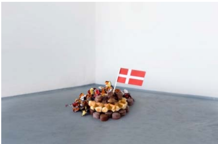
Salvatore Viviano: Opening Performance 2011, compilation of Gelitin performances.

18. jan. 2011 [Baggrund] De vanlige kunstbegreber strander ofte i mødet med performancekunstens direkte henvendelser. Det vil Camilla Jalving gerne lave om på. Læs mere